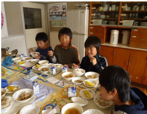
【ランチルーム給食の様子】

「大震災で被害を受けた学校の給食が始まったというニュースを見ました。パンと牛乳だけの給食でしたが、それでもうれしそうに楽しそうに給食を食べていました。子どもたちは口々に『みんなで食べた給食がおいしかったね』『みんなで食べられてよかった。』と感想を言っていました。」子どもたちは、その話をじっと聞き入っていました。