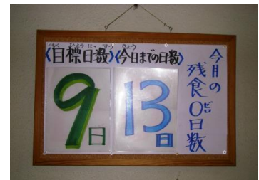
【11月の残食ゼロ掲示】

2学期の朝会では、残食ゼロの日を増やそうというお話がありました。11月の残食ゼロ目標日数は9日(昨年度の同数)でしたが、何と13日を達成しました。子どもたちは、「食」の大切さや「友達とともに給食を食べる楽しさ」などを日々学んでいます。この給食週間を機会に、改めて健やかに生きるための基礎を培う「食」について見直していきたいと思えます。