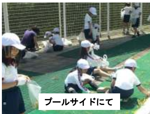
プールサイドにて

5校時にプールサイドの清掃をしました。大きく伸びた草をみんなで一生懸命抜くことができました。清掃後には見違えるほどきれいになったプールサイドを見て、子どもたちは早く水泳を始めたいという思いでいっぱいだったことと思います。