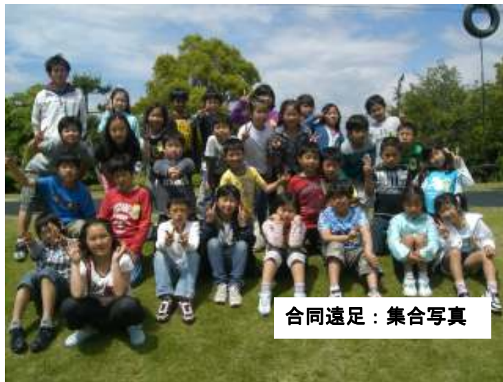
合同遠足：集合写真

6月1日は、参観会、懇談会があります。参観会では、今まで一生懸命練習してきました国語科「きつつきの商売」の音読発表会を行います。子どもたちは、保護者の皆様にたくさん来ていただこうと、丁寧に招待状も作成いたしました。子どもたちの頑張りをぜひ御覧ください。参観会後は、懇談会も行われます。有意義な会にしていきたいと思います。御出席よろしくお願ひいたします。