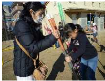
【前に倒してバランスをとってね】

けん玉 (U・S) ぼくは、むかしのあそびでけん玉にチャレンジしました。いつもいつもやってもできなかったけれど、きょうねばりづよくあげたら、1かいのりしました。