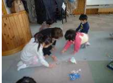
【おはじき うまく当ててね】