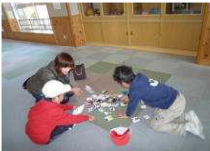
【めんこ ひっくり返すぞ】