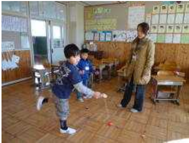
【けん玉 お皿にのるかな】