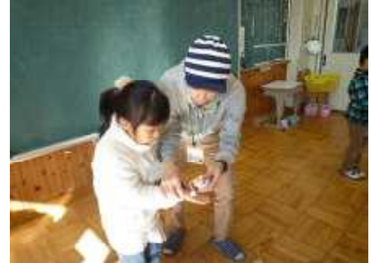
【こま 持ち方のこつはね】