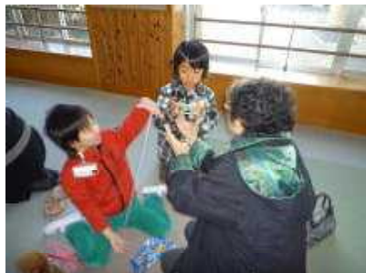
【あやとり 基本型はね】