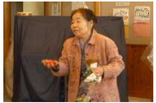
【お手玉の技を披露する名人】

子どもたち一人一人に、丁寧に話し掛けて教えてくださったので、子どもたちも俄然やる気を出し、技のこつをつかもうと一生懸命に取り組みました。