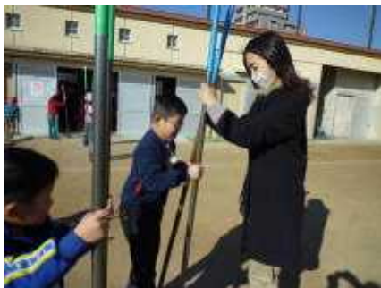
【竹馬 最初の一步を頑張れ】