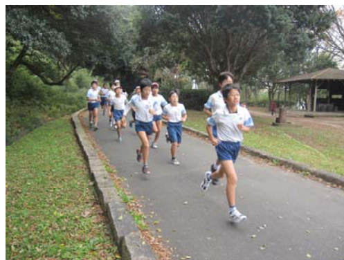
▲ 実際のコースを試走しました。