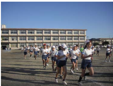
▲ 隔日で朝マラソンをしてきました。