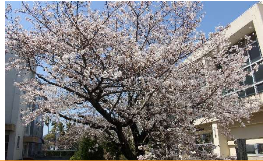
地域とともにある学校づくり の実現に向けて