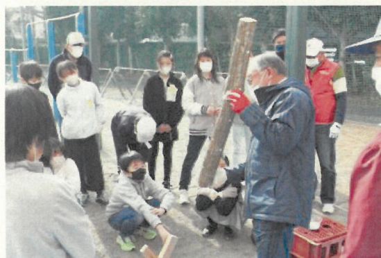
2月2日地域まちづくり協議会