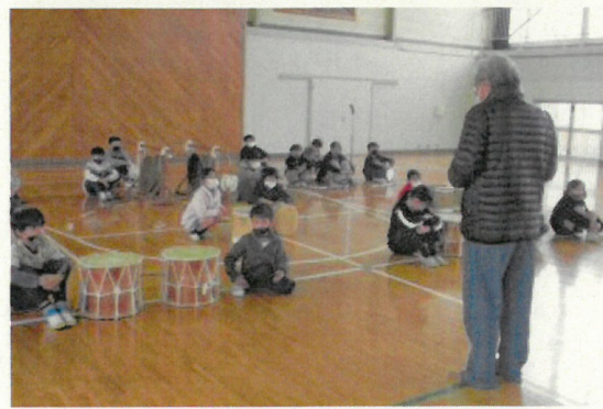
2月13日放歌踊り保存会