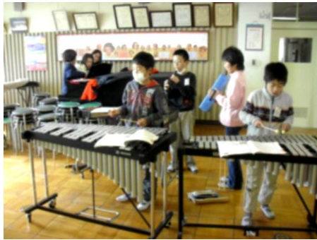
■5年音楽 「曲想を生かして合奏しよう キリマンジャロ」 気に入った楽器の周りに集まり、夢中になって練習しています。