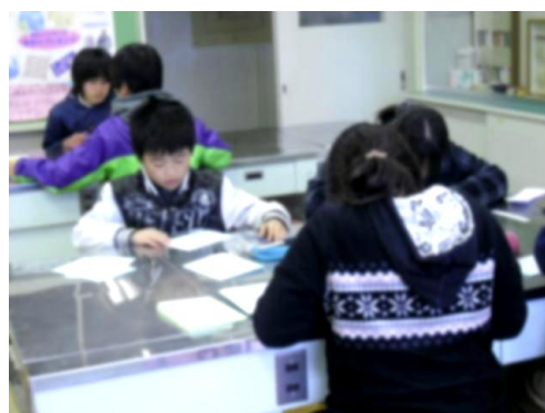
■美化委員会の活動から