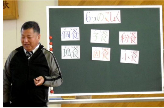
■感謝の会 「個食・子食・粉食・孤食・固食・小食」今、食があぶない！