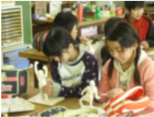
■6年図画工作 色塗りも近いです。