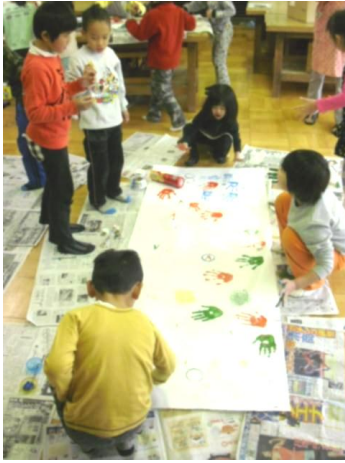
■1年図画工作 鮮やかないろどり