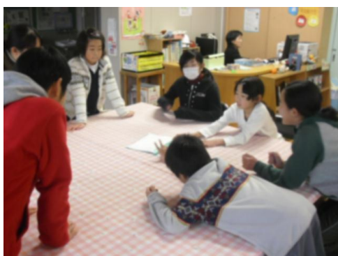
■図書委員会の活動から