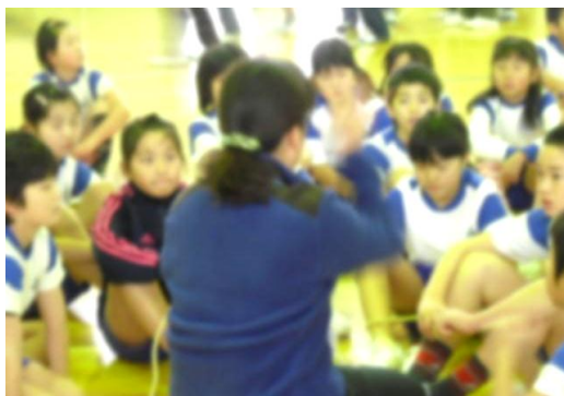
■4年 長縄について真剣に作戦会議