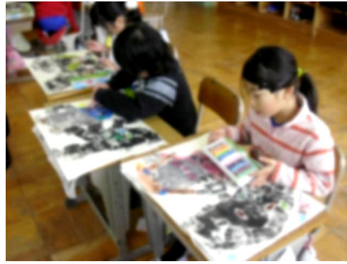
■3年図画工作 紙版画に色付け