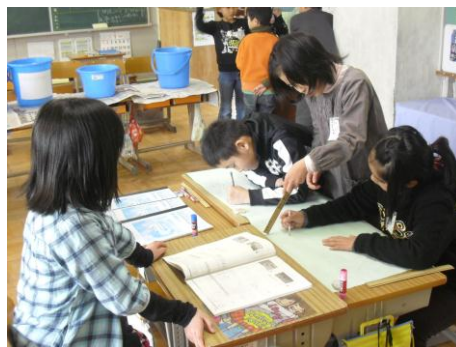
■3年 児童会祭りの準備