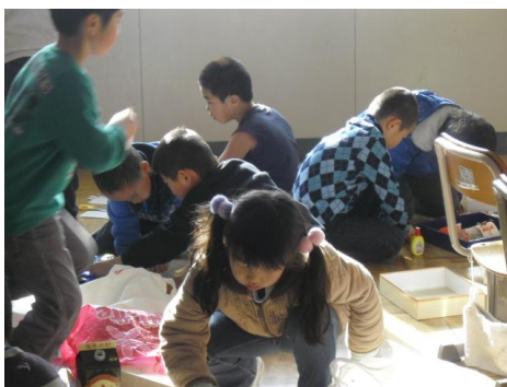
■1年 児童会祭りの準備に没頭しています。