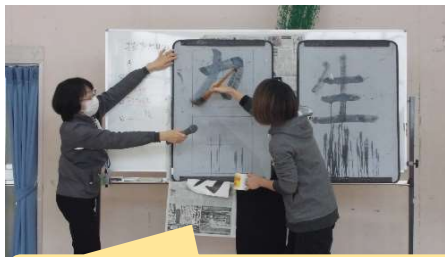
文字は勢よく書こう。

先生とボランティアの方々が、太筆の使い方を丁寧に教えたり、文字を書く時の気持ちやコツを教えてくださいました。