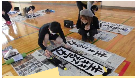
上手に練習出来たね。