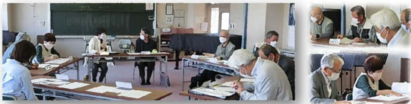
第1回学校運営協議会会議の様子

5月11日(水)に第1回学校運営協議会が開催されました。新しい委員の方も加わり新たな気持ちでスタートを切ることができました。