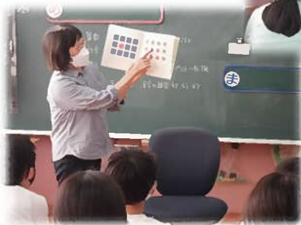
4・5年生 SDGs 講座