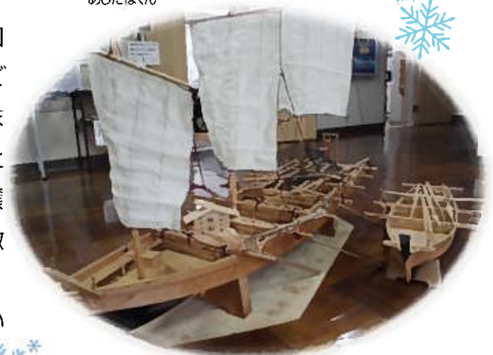
職員玄関前に置かれている鯉船の模型

今年度最後の運営協議会は令和5年2月15日(水)になります。学校運営協議会は開かれた議会ですので傍聴も可能です。(申込書はHPにございます)