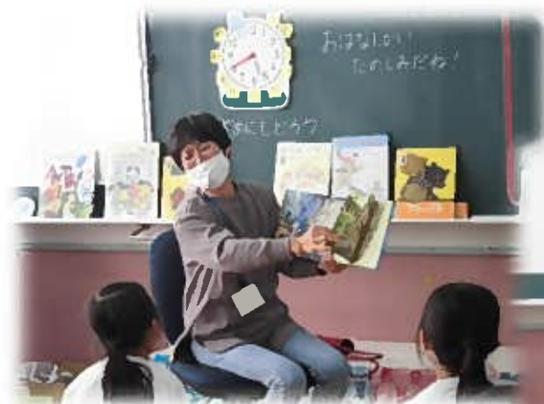
全校 竜宮館お話し会