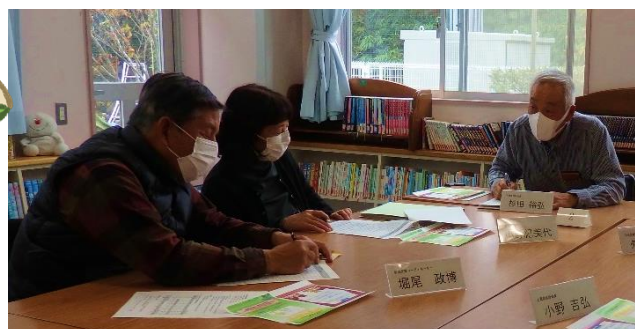
【授業の様子を参観】