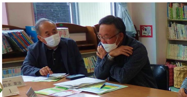
【グループ協議の様子】