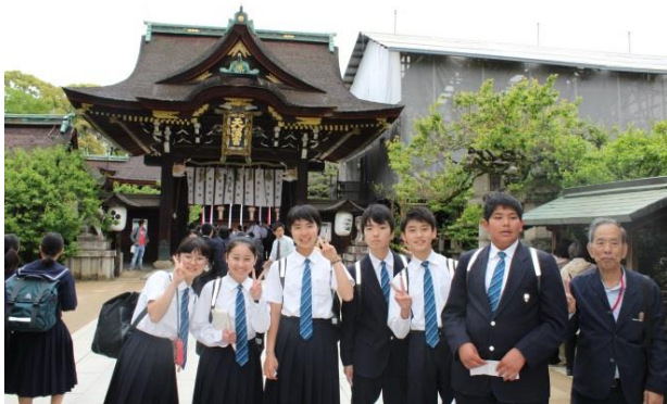
「学問の神様」菅原道真をまつる北野天満宮にて