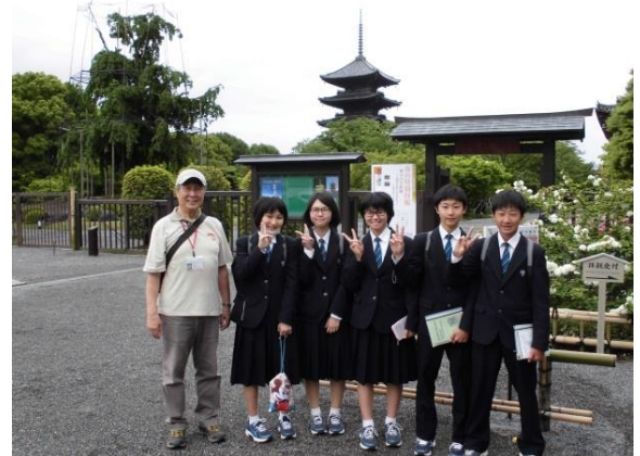
仏像の宝庫 東寺にて