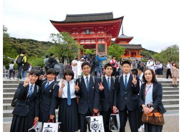
2日目はシルバーガイドさんと一緒に京都班別研修！多くの人が訪れた清水寺にて