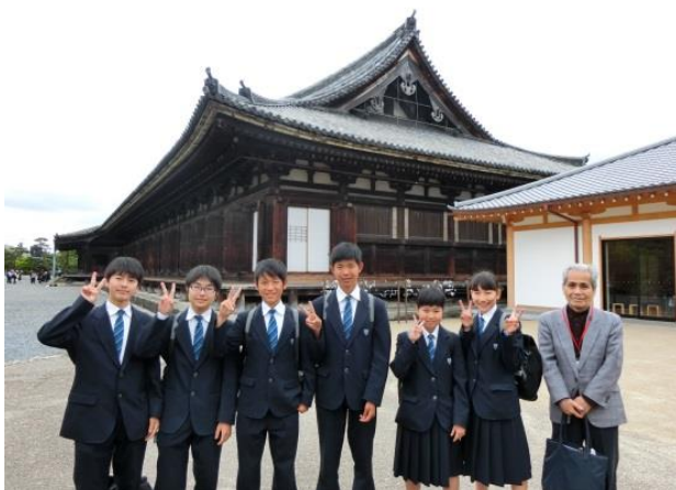
1001体の千手観音像は圧巻！三十三間堂にて