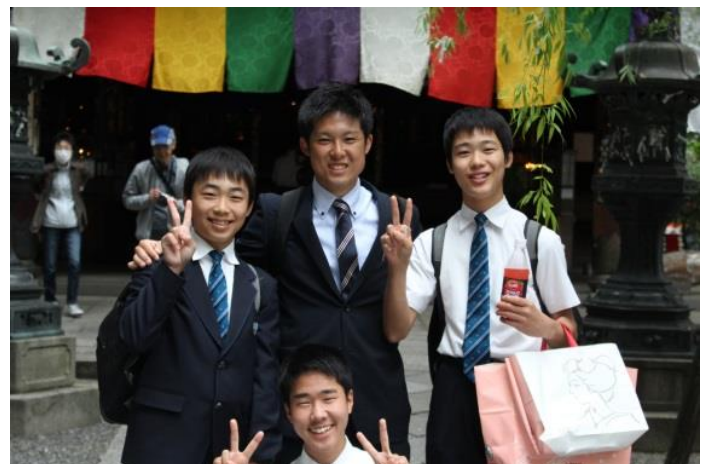
ホテルに最も近い場所にあった六角堂にて