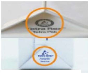
牛乳・豆乳・ジュース スムージー・お茶 など 容器サイズはさまざま