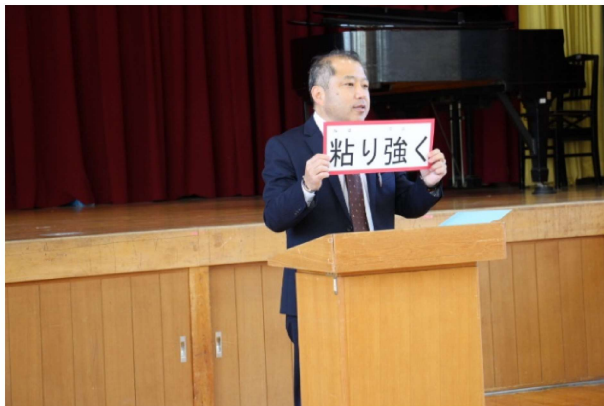
『 校長先生の話 』

浦川小にとって最後の1年。浦川っ子8人が、どの活動にも“粘り強く”取り組み、自分らしさを輝かせられるよう、全教職員一丸となって努めてまいります。保護者や地域の皆様、昨年度に引き続き、お力添えをよろしくお願いいたします。