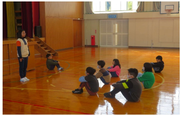
『 児童代表 がんばりたいことの発表 』