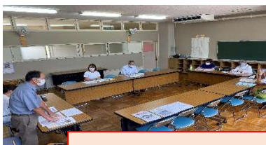
学校運営協議会の様子

モデル校時期を合わせてコミュニティ・スクール4年目となった浦川小学校では、委員の理解も良く、学校行事への積極的な参加や、意見も多くなっています。今回は、地域の昔のことや祭りのことなど、子供たちに伝えていくためにはどうしたら良いのか意見を出し合い、熟議しました。休憩後、地域学校協働本部の会議も開催しました。地域で活躍している各種団体の代表