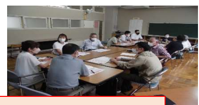
地域学校協働本部の様子