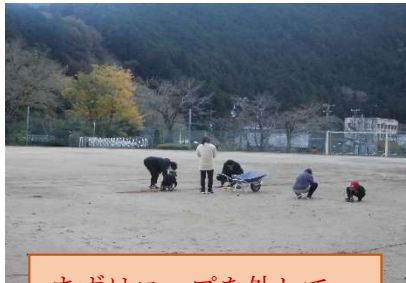
まずはロープを外して…

まずはグラウンドに張られていたロープを外し、自動車を使い整地しました。これを行うことで表面を削り、苔を剥が