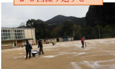
塩化カルシウム散布(地域の方も)