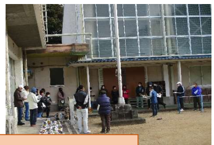
二回の試走、そして当日、保護者・地域の方による監察ボランティア