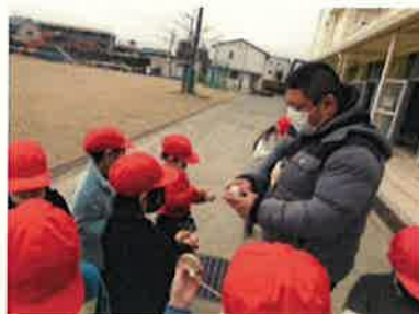
<こま上手に巻けるかな?>