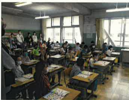
【 4/22 参観会 】