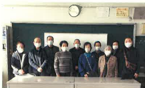
<12/15に参加くださったみなさん>