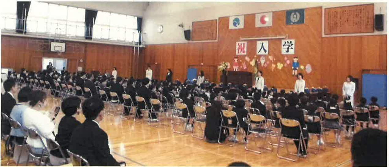
【 4/7 入学式 】