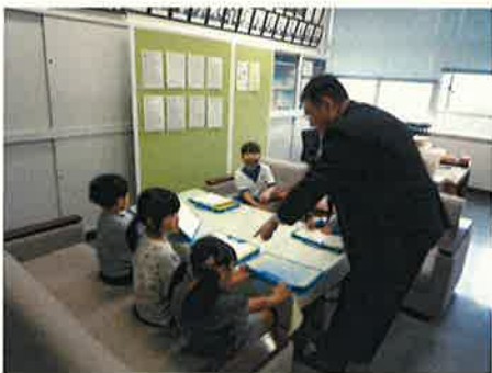
【 4/26 学校探検 】