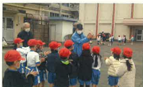
<竹とんぼに挑戦中>