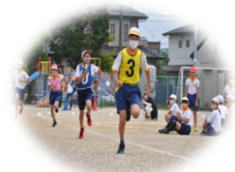
スポーツフェスティバル

全員リレーでは、どの学年も、チームの仲間と協力し、タイムが縮まるようチャレンジする姿が見られました。また、全員リレー以外の種目では、それぞれの学年が努力してきた姿が見られました。まさに、「たくましい子」の姿でした。