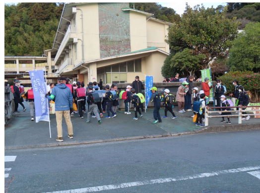
あいさつ運動（杉の子の日）