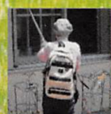
PTA 大掃除 ボランティア