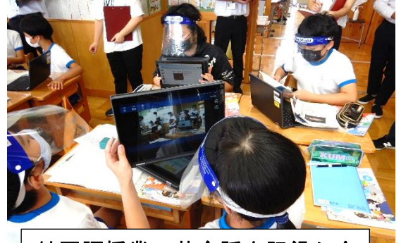
外国語授業で英会話を記録し合い自分の発音を振り返る場面

井伊谷小学校では、タブレット PC が児童数の約7割程度の台数が配置されました。授業では、「グーグルワークスペース」や「ミライシード」というアプリケーションを活用して、協力をして何かを作ったり、分析したり、コミュニケーションや表現ツールとして活用したりするなど、特定の教科に限らず活用しています。子供たちのタブレット PC への適応は、大人が考えている以上に速く、文具のように活用できている姿は、さすが現代っ子です。浜松市では、今後一人一台配置できるように整備が進められています。現在浜松市で配置している端末は、「クロームブック」です。OSは、「クロームOS」となっています。今後家庭への持ち帰りがあった場合、インターネットへの接続等で保護者様にもご協力いただく場面もあるかと思えます。ご理解ご協力をお願いいたします。