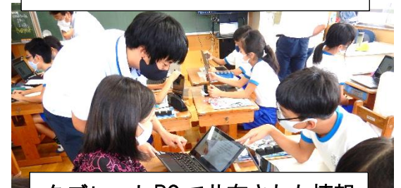
タブレットPCで共有された情報で話し合いも盛り上がります