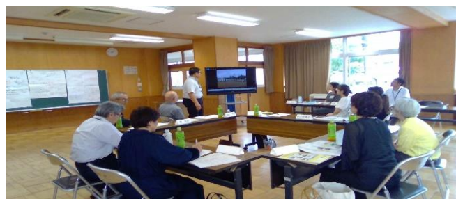
第3回学校運営協議会の様子