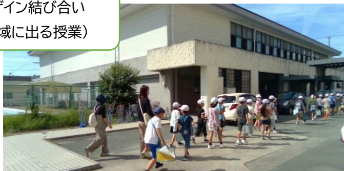
3年生学区探検(蒲神明宮・蒲協働センター・宝珠寺)