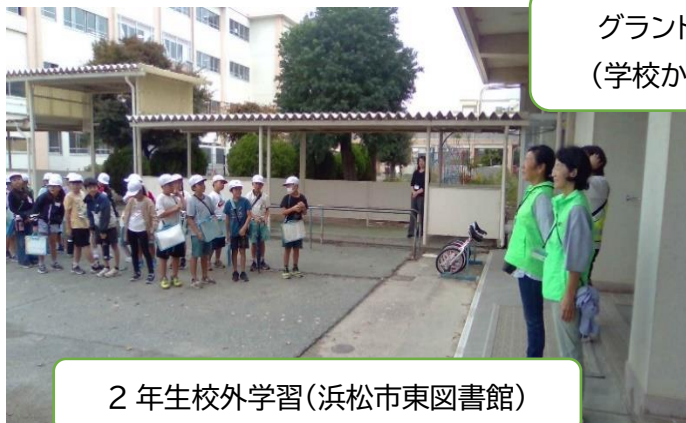
2年生校外学習(浜松市東図書館)