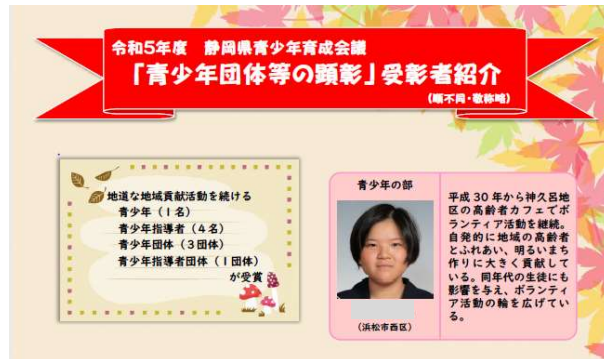
静岡県青少年育成会議資料より抜粋