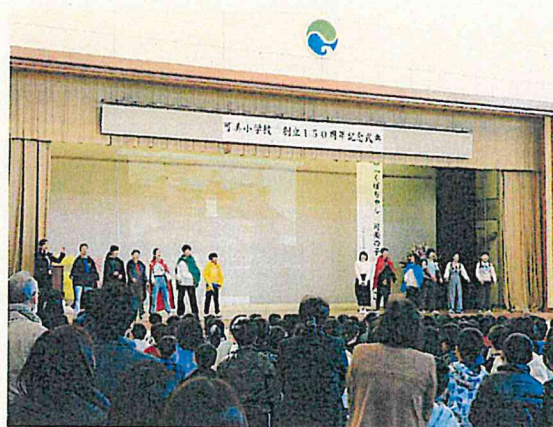
【創立150周年記念式典（12月）】