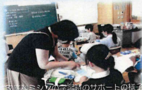
家庭科 ミシンの学習時のサポートの様子