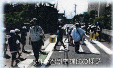
校外学習引率補助の様子