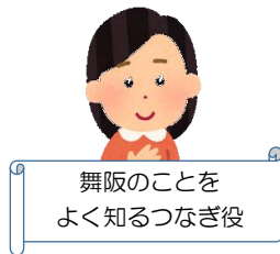
舞阪のことを よく知るつなぎ役