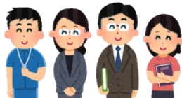
校長・教頭・CS担当教員 CSディレクター（事務担当）