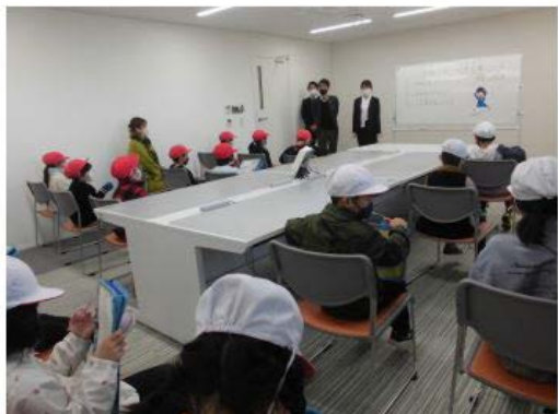
◎浜松磐田信用金庫三方原支店さん