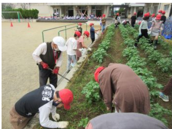
3年生と一緒にじゃがいも畑の草とり