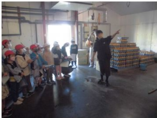
◎まいたけセンター さん