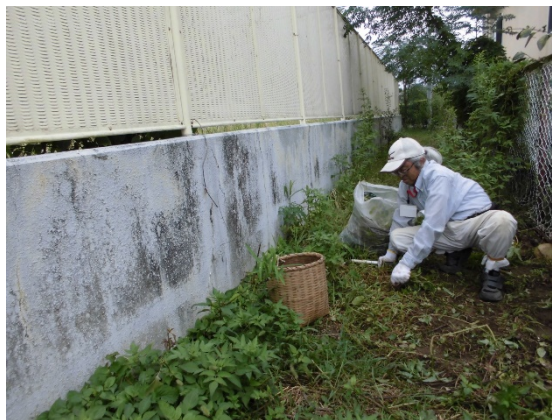
草取りに加え、伸びた樹木の剪定