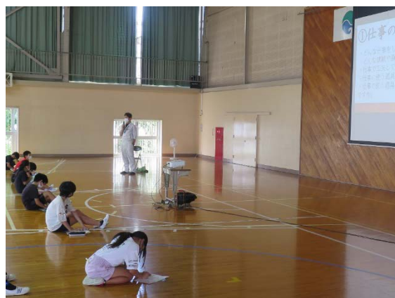
観光施設従業員さん