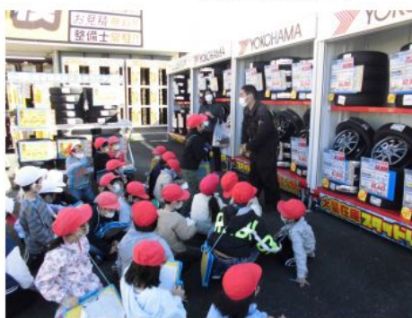
◎イエローハット三方原店 さん