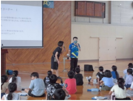
～ 視 覚 障 が い 講 話 ～

4 年 生 は 「 自 分 た ち に も で き る 福 祉 」 に つ い て 学 習 し て い ま す 。