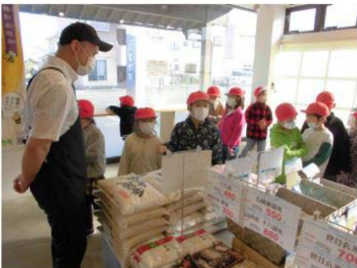
◎おにぎりのはせがわさん