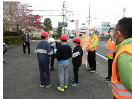
～ 地 域 包 括 支 援 セ ン タ ー の 方 と 近 隣 の 店 舗 の 協 力 に よ る 、 高 齢 者 徘徊 模 擬 訓 練 ～