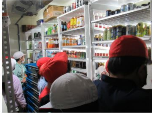
◎セブンイレブン浜松三方原北店 さん