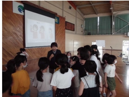
～ 北 区 役 所 社 会 福 祉 課 の 方 ・ 聴 覚 障 が い の あ る 方 と の 手 話 講 座 ～