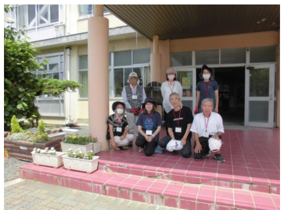
環境ボランティアの皆さん（初回撮影）