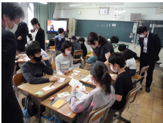
悩みながら選びます