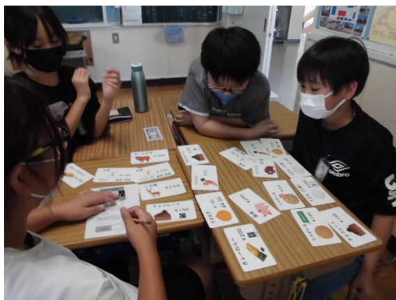
どれがいいのかな？これかな？