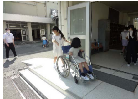
～ 北 区 役 所 社 会 福 祉 課 の 方 、 保 護 者 ボ ラ ン テ ィ ア さ ん の 協 力 に よ る 車 い す ・ 白 杖 ・ ア イ マ ス ク 体 験 ～