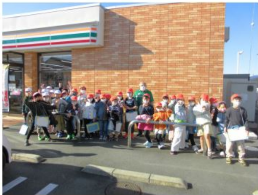
◎セブンイレブン三方原東店 さん