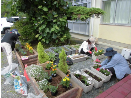
プランターへ花の植え付け

環境ボランティアの皆さんには、花壇の整備や校内の草取りをお願いしています。活動は6月下旬より開始しました。毎月第2・第4木曜日に活動してくださっています。