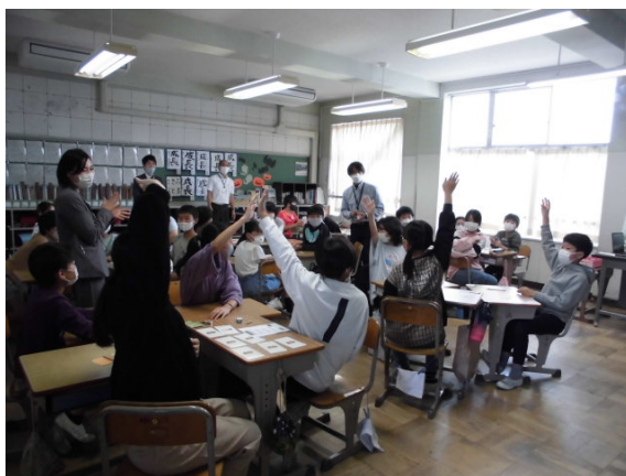
結果を発表しました。