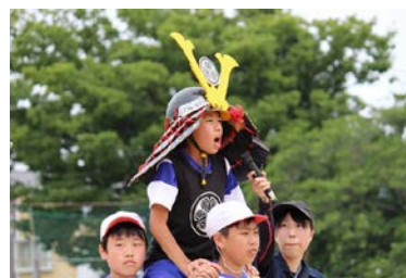
三方原小の伝統 「三方原合戦」