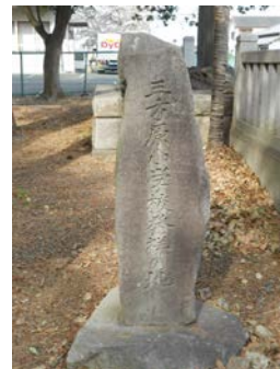
三方原小学校発祥の地 （三方原神社）