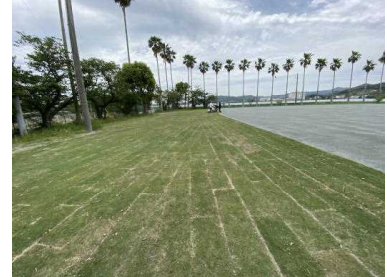
きれいになりました！