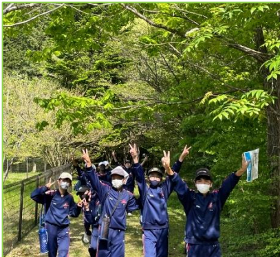
<1日目：ウォークラリー>