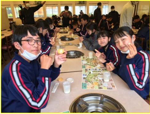
<3日目：まかいの牧場>