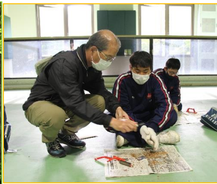
<1日目：オリジナルスプーンづくり>