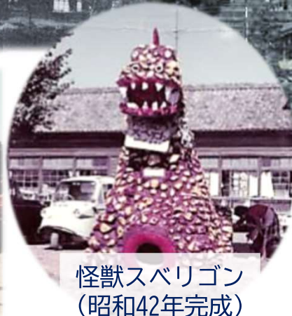
怪獣スベリゴン (昭和42年完成)