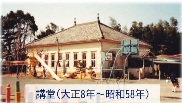
講堂(大正8年～昭和58年)