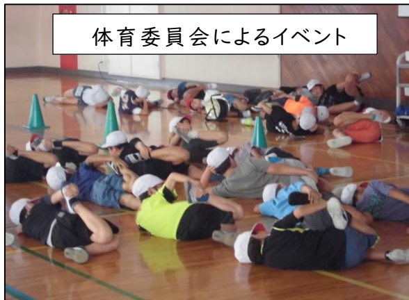
体育委員会によるイベント

活動への取り組みを通して、子供たちは、社会の一員として生きていくために、物事をやり遂げる責任感を学び、そこで得られる達成感を感じながら、“誰かのために何かをする喜び”も体験しています。