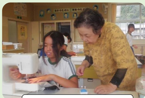
6年家庭科ミシン見守り