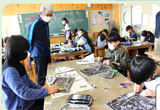
4・5年図工 彫刻刀安全見守り