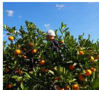
学校で収穫したみかんの糖度は高いもので12.4度でした。

本校では、インフルエンザが例年よりも早く流行しました。今後も健康に留意し、対策を進めてまいりたいと思います。