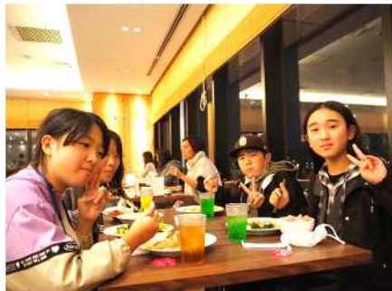
夕食は、ソラマチの中でバイキング