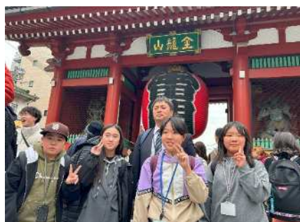
浅草ではいちご飴をおいしく食べました