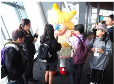
スカイツリーではソラカラちゃんと写真撮影