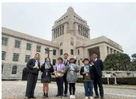
国会議事堂では特別見学ができました