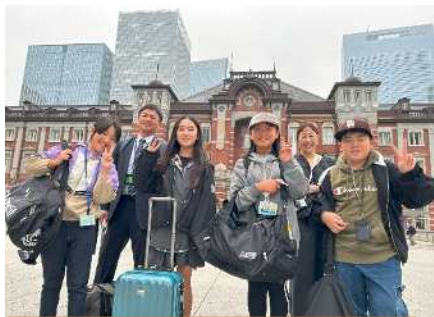
東京駅は大きく素敵な建物でした

11月13日(木)14日(金)に、6年生は修学旅行で東京に行ってきました。事前に学習をして国会議事堂や浅草、東京スカイツリー、そして楽しみにしていたディズニーランドを訪れました。初めて見聞きすることが多く、はじめは戸惑いましたが、徐々に笑顔が増えました。天候もよく、地下鉄を乗り継ぎながら日本の首都を感じることができた2日間でした。