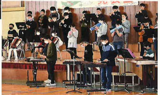
【ドラゴン発表会(6年生)】