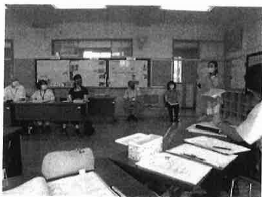
各学年の活動を発表