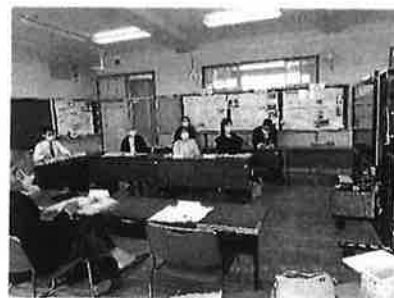
協議会の意義を再確認

続いて、校長が本年度の学校経営方針を説明しました。経営構想図や保護者の皆様にも配付した『子供たちに育てたい能力の育成指標』などを用いながら行い、全委員がそれを承認しました。