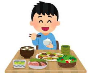
よ バランスの良い食事