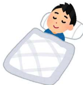
じゅうぶん 十分なすいみん