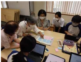
7/5 生徒と地域の方の 意見交流

「地域と共にある学校づくり」とするために佐久間中学校 学校運営協議会としてできることは？