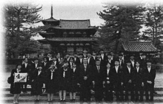
法隆寺でのクラス写真