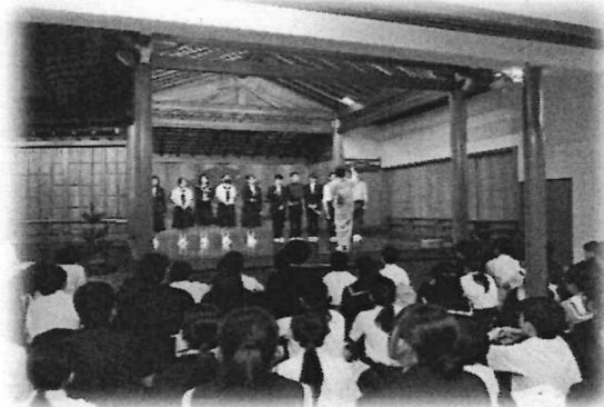
修学旅行での能舞台体験