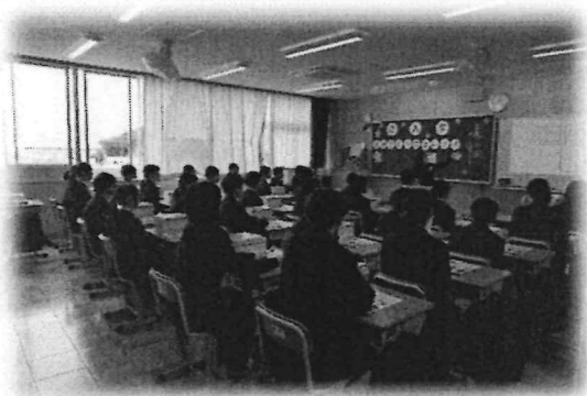
入学式での新たな出会い