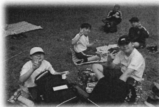
ほまれ佐鳴湖ウオーク