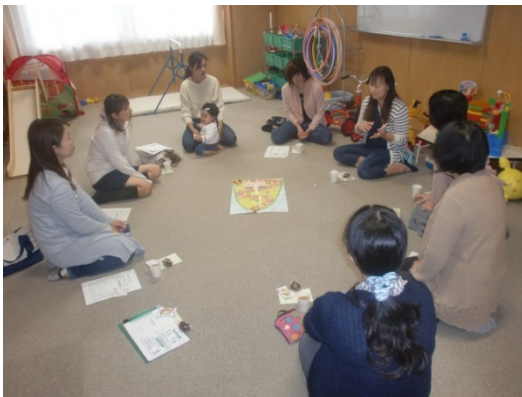
きつおんカフェ（吃音保護者会）

通級児の笑顔が、私たちにとっては何よりの元気の素…。着実にことばの力を伸ばすと共に、子どもたちや保護者にとって、ほっとできるような心の居場所となるようにしていきたいと思っています。