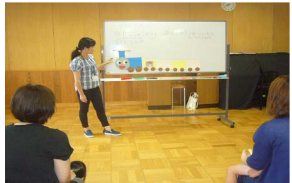
グループ指導（しりとり列車）