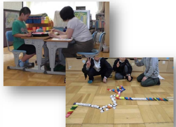
個別の指導・グループ指導

LD通級には、下記の障害に留まらず、様々な悩みを抱えた児童や保護者が集まってきます。そのため、年間2回の個別面談や保護者交流会を行い、支援に努めています。他に在籍校訪問を行い、学級担任と指導目標や指導方法について話し合いを行っています。