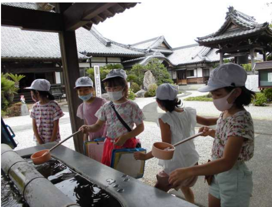
< 龍秀院 >