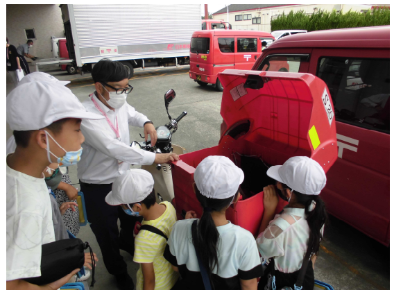
< 郵便局 >

生活科の学習で「町たんけん」に行きました。積志小学校の周りには、どんな物やお店があるのかを調べました。初めての校外学習で、子供たちは張り切って探検に出かけました。「虹色の電車が走っていたよ。」と話をしたり、高級車の値段に驚いたりしていました。また、どんな店があったのか、御家庭での話題にさせていただけたらと思ひます。