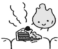
食べたものの消化を助ける