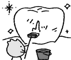
歯についた食べかすを洗い流す