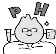
歯についた「酸」を中和する