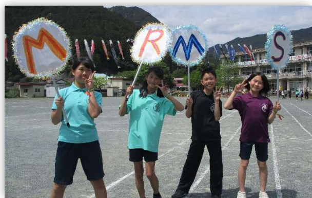
エンディング後の4人。みんな大勢の前で堂々 と感想を発表することができて立派でした。