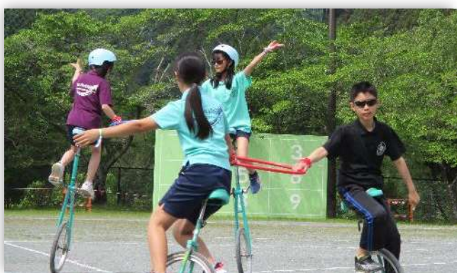
横山小 最後の運動会。たくさん練習してきた 一輪車の演技では、多くの感動を与えました。