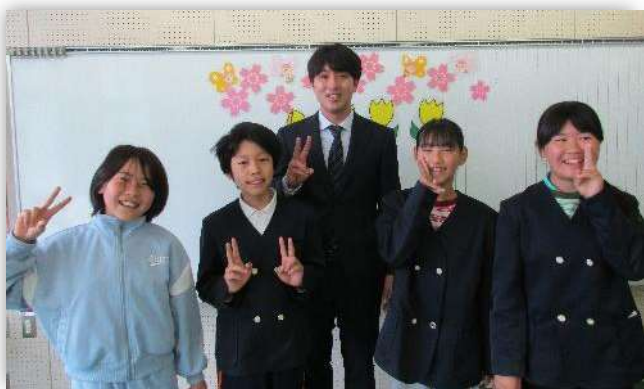
令和8年度スタート。合言葉は「みんなで リレー 未来へ スタート (MRMS)」！