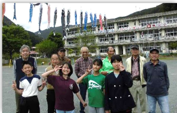
団子クラブの皆さんと記念撮影。こいのぼりの 調整をいつもありがとうございました。