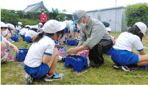
○ 2年生 生活科「野菜づくり」 5/11②③校時